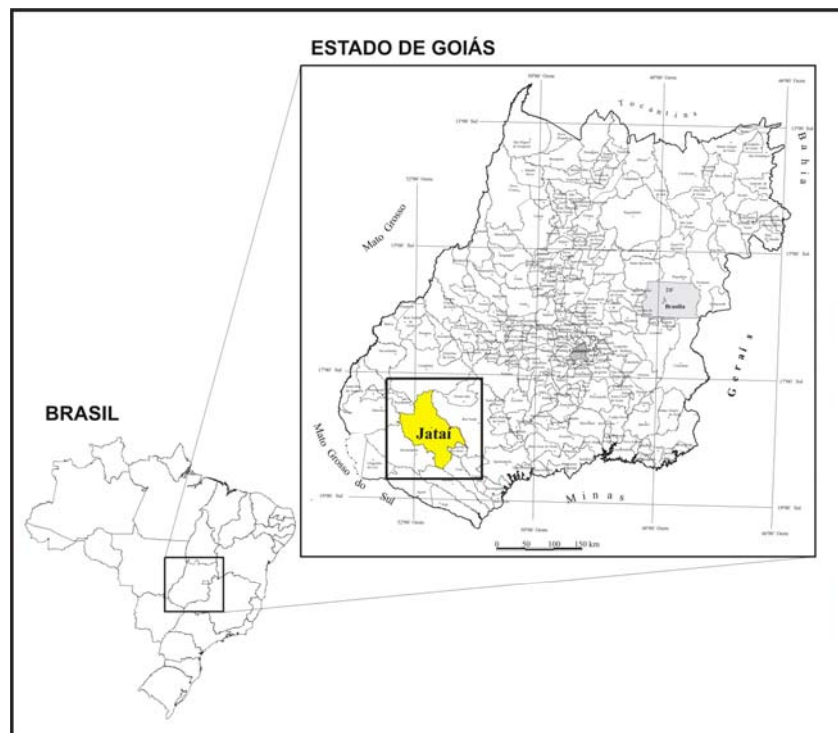
FIGURA 1 - LOCALIZAÇÃO DO MUNICÍPIO DE JATAÍ (GO)